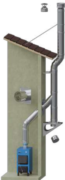
Для котла/печи вдоль наружной стены